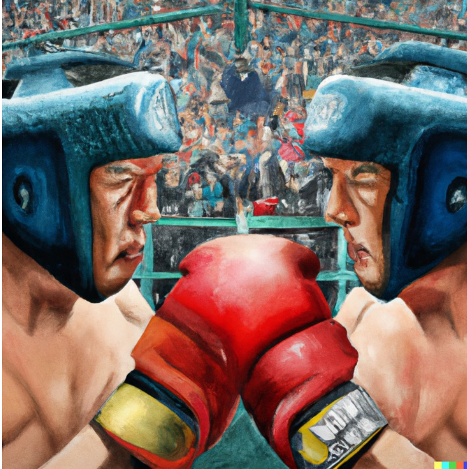
Imagen generada con DALL·E

Siempre que aparece una tecnología prometedoramente disruptiva viene acompañada de discursos y posturas tecnófilas y tecnófobas